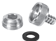
Рисунок 2 – Переходник на кран с муфтой

На кране с внешней резьбой скрутите аэратор (ситечко) со смесителя и накрутите переходник.