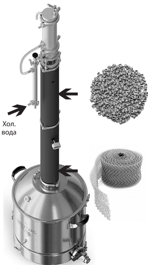
Рисунок 6 – Сборка в режиме ректификации

Холодную воду подаём в нижнюю трубку доохладителя. Верхняя трубка доохладителя соединяется с нижней трубкой дефлегматора. Отвод воды осуществляется из верхней трубки дефлегматора. Проверяем герметичность, подавая воду в систему. Далее для экономии воды до нагрева колонны воду отключаем. Термометр устанавливается в нижнюю царгу.