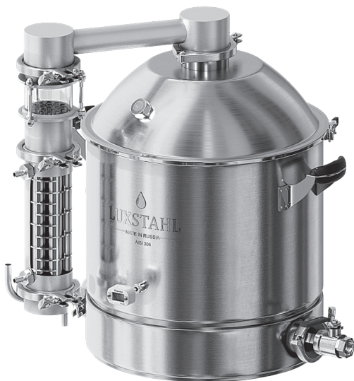
Рисунок 5 – Сборка в режиме простой перегонки

После 1 перегонки дайте аппарату остыть. Можно быстро охладить детали аппарата под краном. Разбирайте аппарат в последовательности – 1) холодильник; 2) узел; 3)