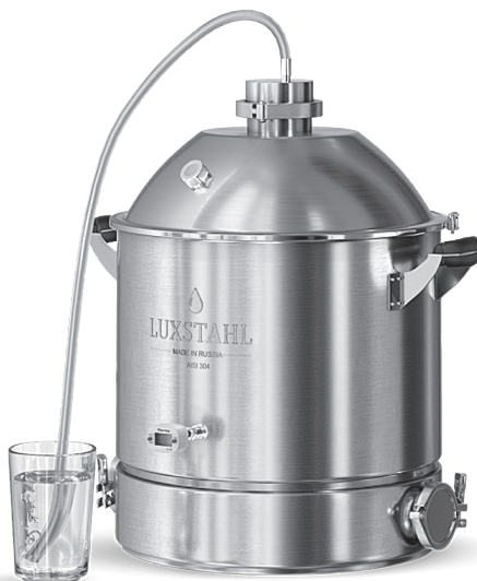
Рисунок 3 – Сборка в режиме брожения браги

Промойте куб горячей водой и ополосните кипятком из чайника. Чем меньше посторонних микробов (кроме дрожжей) попадёт в брагу – тем лучше.